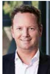
Jörg Strohmeier © Goldbeck

In rasender Geschwindigkeit entstand die Tesla-Fabrik Grünheide. Immerhin erging ein großer Teilauftrag zur Errichtung an das Unternehmen Goldbeck auch durch Elon Musk: Gewissermaßen ein Synonym für Geschwindigkeit. Das auf das elementierte Bauen mit System spezialisierte Familienunternehmen hat Musk in allen Verhandlungen klar fokussiert, schnell entscheidend und absolut konsequent kennengelernt.