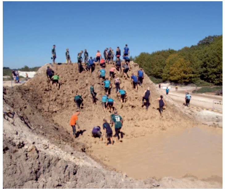
Der internationale Hindernislauf Mud Masters Obstacle Run lockt jährlich mehr als 20.000 Läufer in den Betrieb.

Aufgrund schnell voranschreitender Verbuschung eines Teilgeländes wurde z. B. in Abstimmung mit dem Naturschutzzentrum und der Gemeinde ein besonderes Pflege- und Nutzungskonzept eingeführt. Ergebnis war, dass schottische Hochlandrinder als „Naturrasenmäher“ die Wiederherstellung und den langfristigen Erhalt eines Wechsels von Wald und (halb-)offenen Zonen steuern.