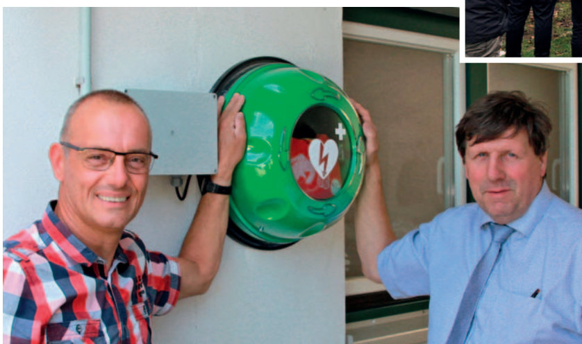
„Gelebte“ Nachbarschaft: Bereitstellung eines Defibrillators für Anwohner.