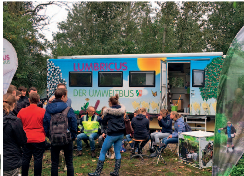
Schülergruppen kommen mehrmals pro Jahr mit dem Umweltbus der Natur- und Umweltschutz-Akademie NRW zu Siemes.